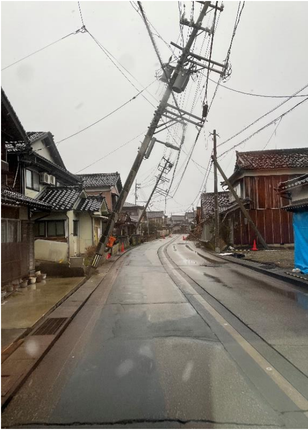
珠洲市内 道路状況