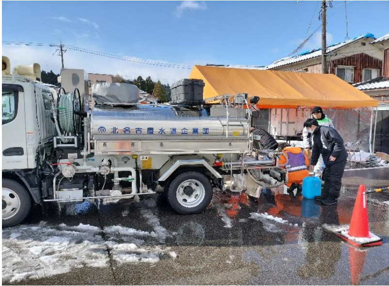
応急給水支援活動 (七尾市内 給水支援所)