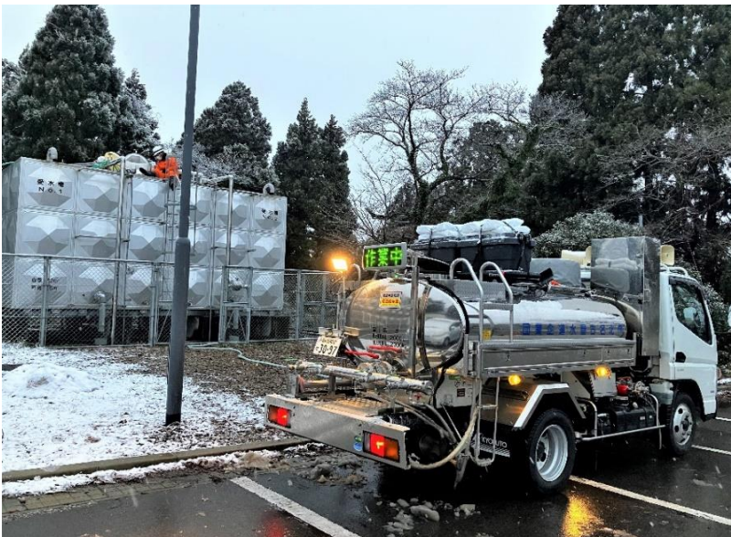
貯水槽への給水 (七尾市内 医療施設)