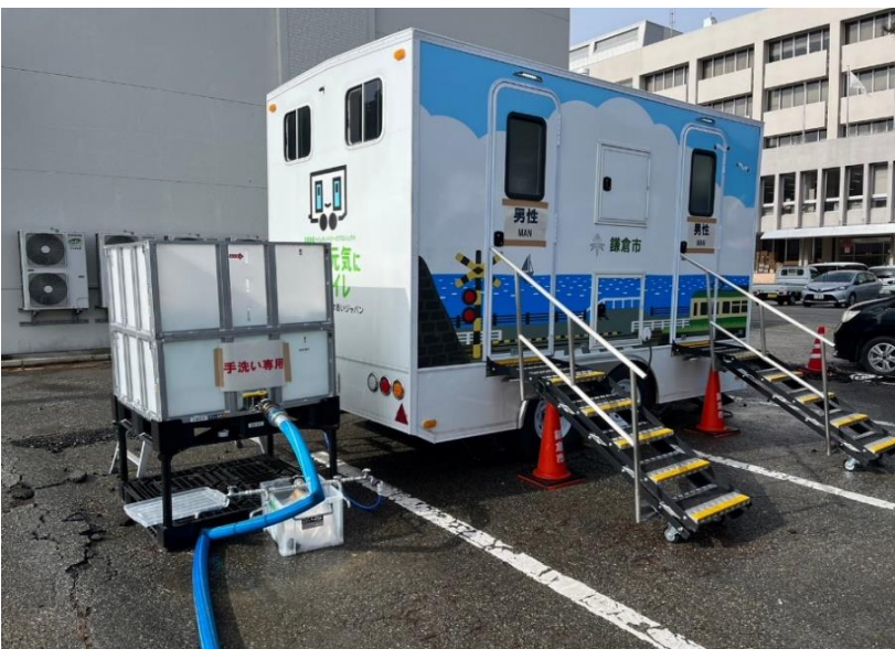
トイレトレーラー横の 組立式仮設給水槽への給水 (珠洲市役所 駐車場)