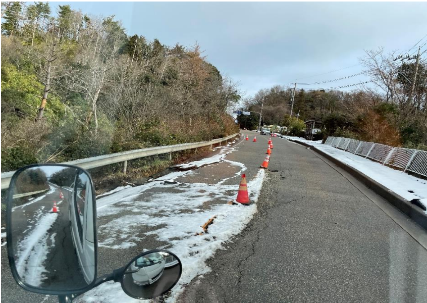
七尾市内 道路状況