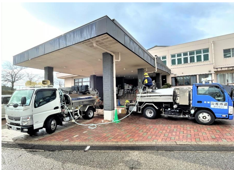
安城市と共に 応急給水支援活動 (七尾市内 避難所)