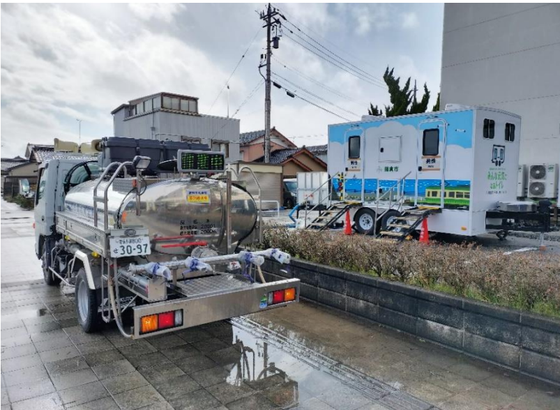
トイレトレーラー横の 組立式仮設給水槽への給水 (珠洲市役所 駐車場)