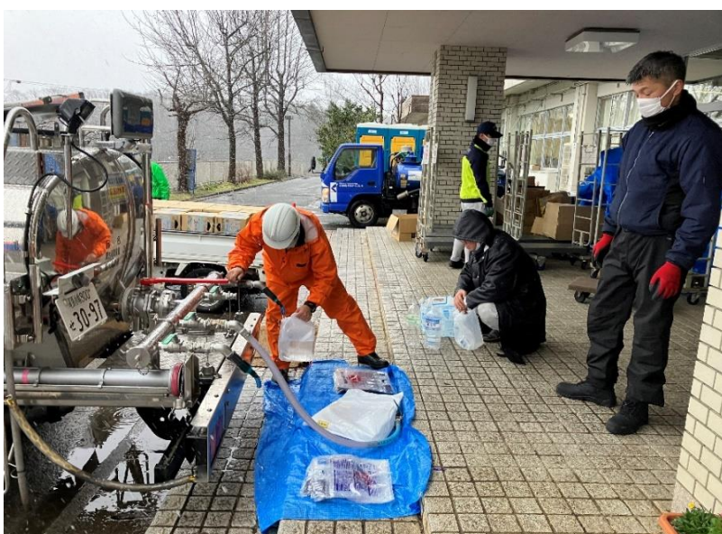
応急給水支援活動 (七尾市内 避難所)