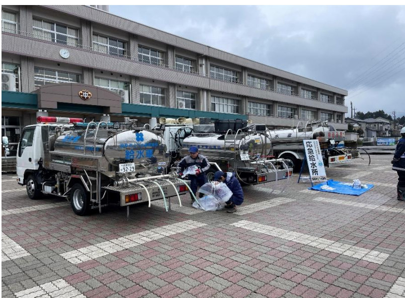
岡崎市、岐阜市と共に 応急給水支援活動 (七尾市内 避難所)