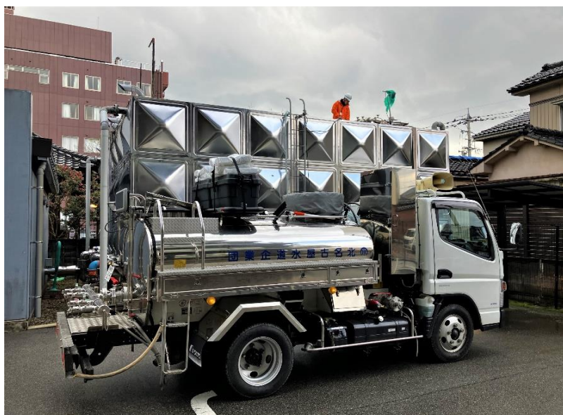
貯水槽への給水 (七尾市内 医療施設)