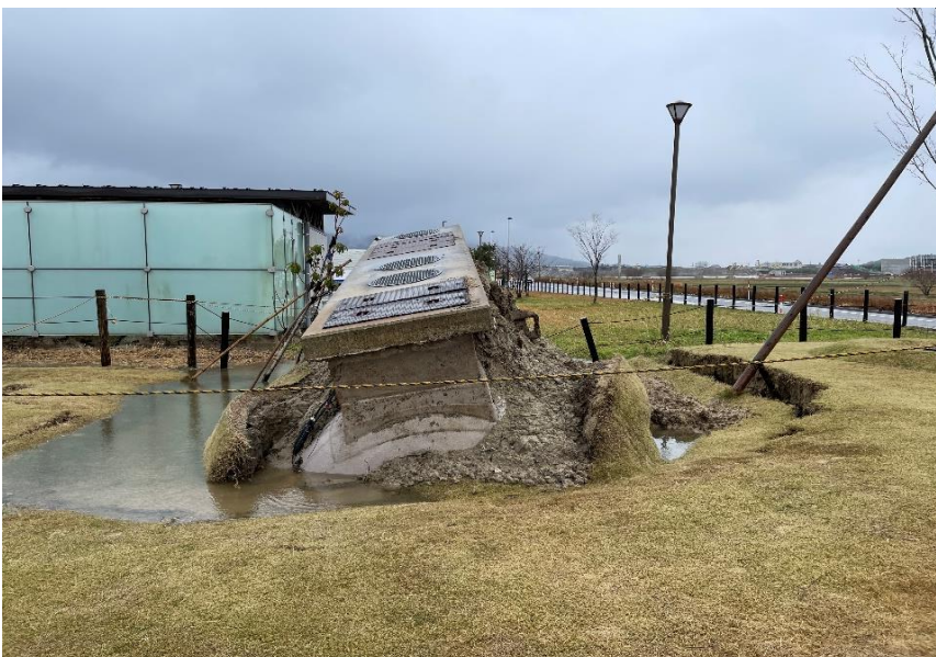
七尾市内 浄化槽浮上