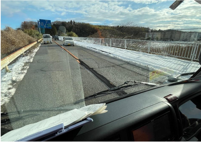
七尾市内 道路状況