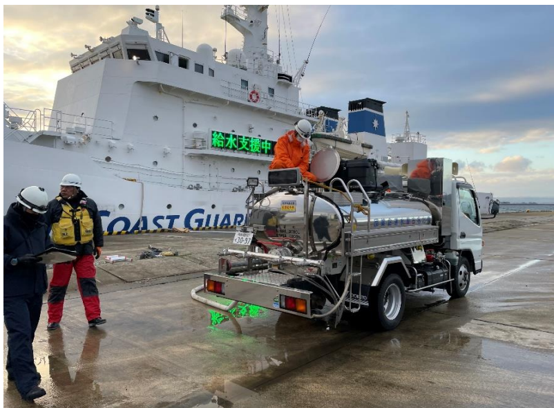
海上保安庁巡視船から 給水車への補水 (七尾港)