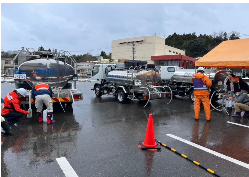
浜松市、南越前町と共に 応急給水支援活動 (七尾市内 給水支援所)