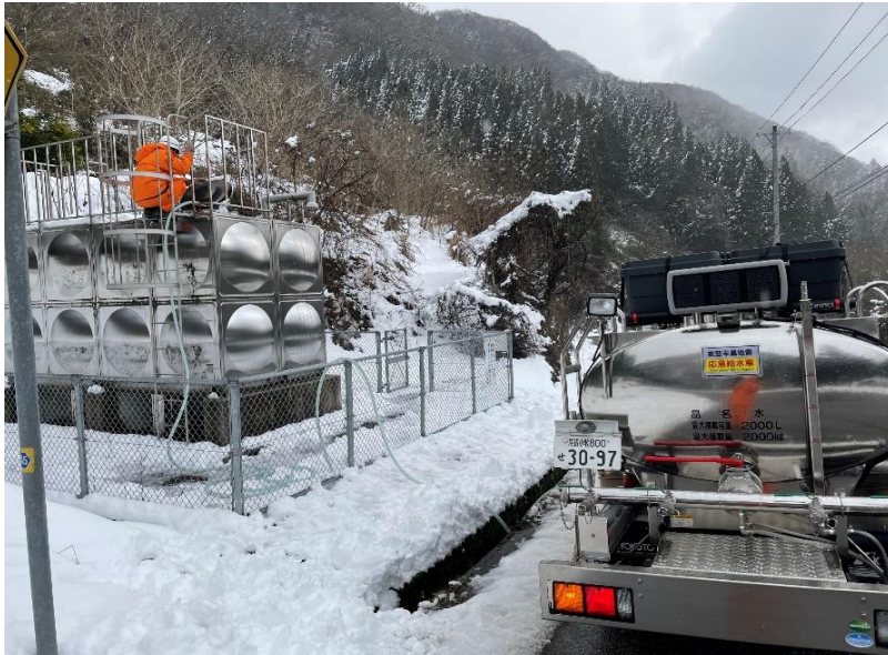
減圧槽への給水 (七尾市内)