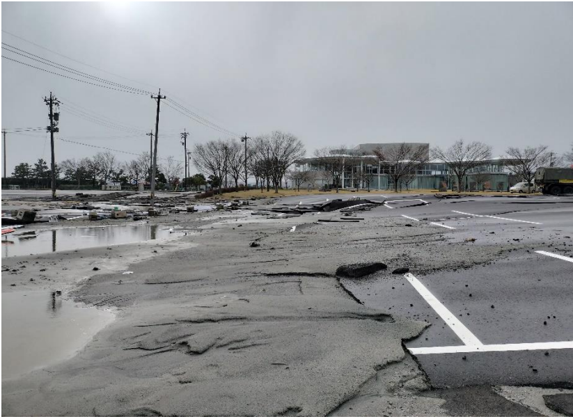
珠洲市内 液状化状況