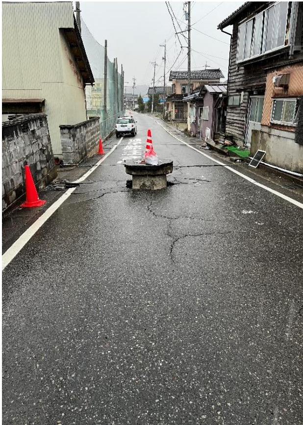
珠洲市内 道路状況