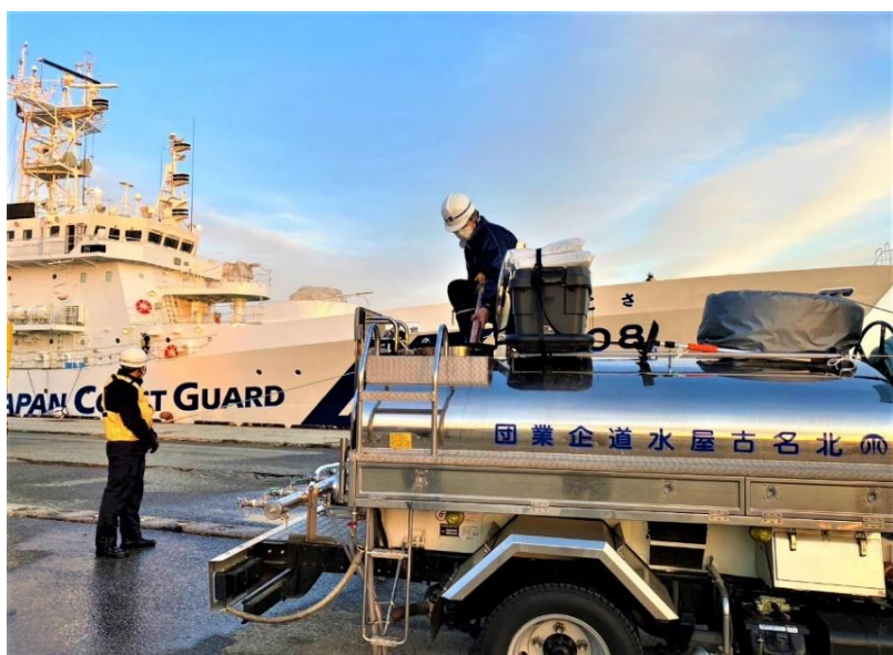
海上保安庁巡視船から 給水車への補水 (七尾港)