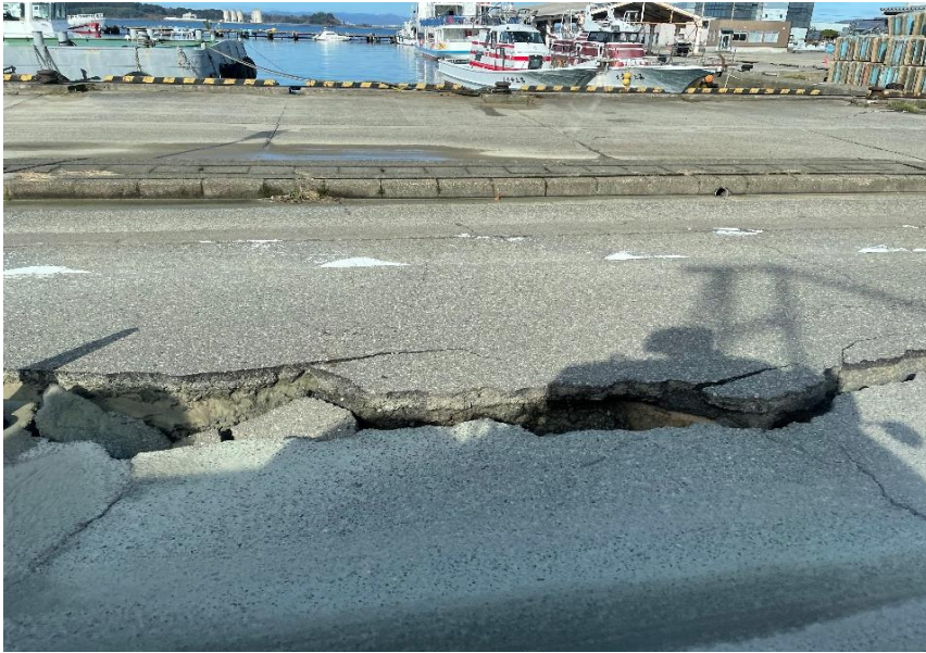
七尾市内 道路状況